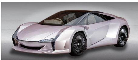
ナノセルロースヴィークル 環境省