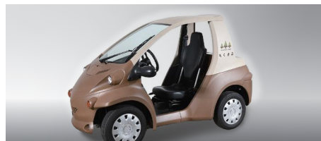
もくまる トヨタ車体株式会社