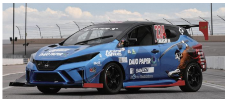
SAMURAI SPEED 大王製紙株式会社